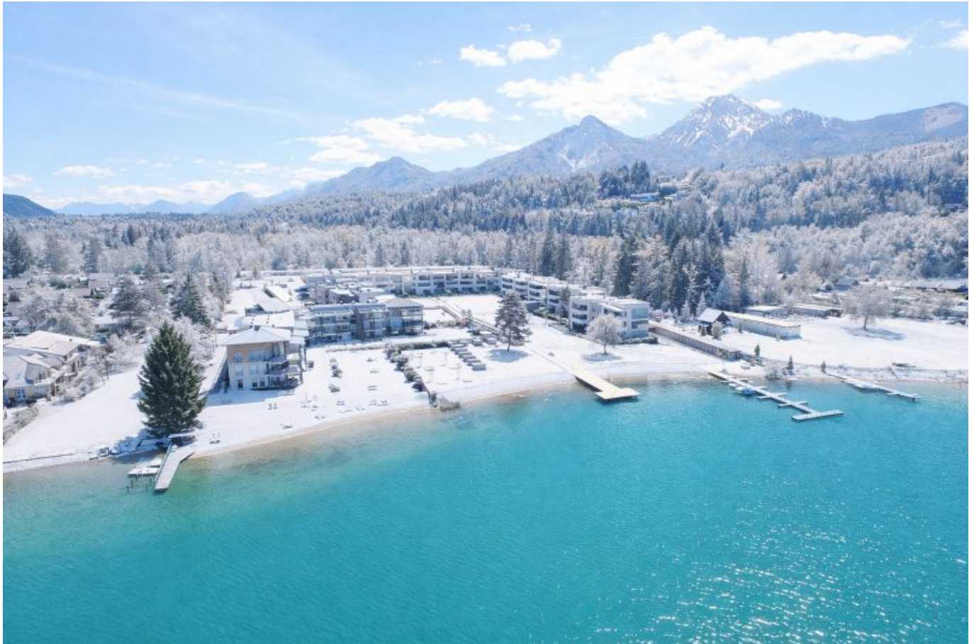
Winter Faaker See

Objektnummer: 905/02985 Eine Immobilie von ATV Immobilien