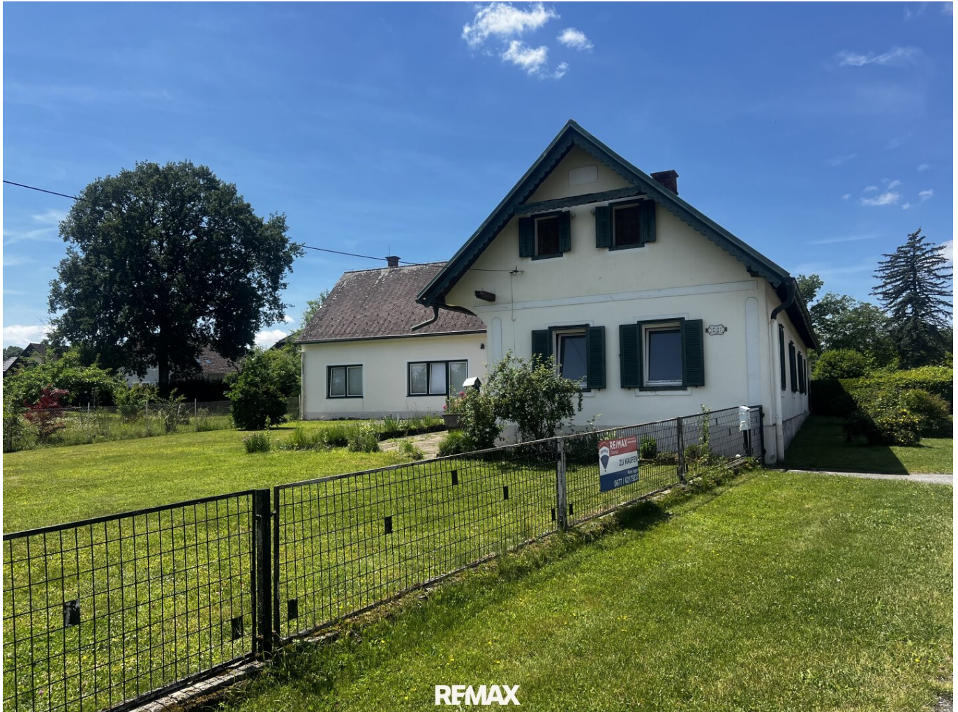
Garten und Hausrückseite