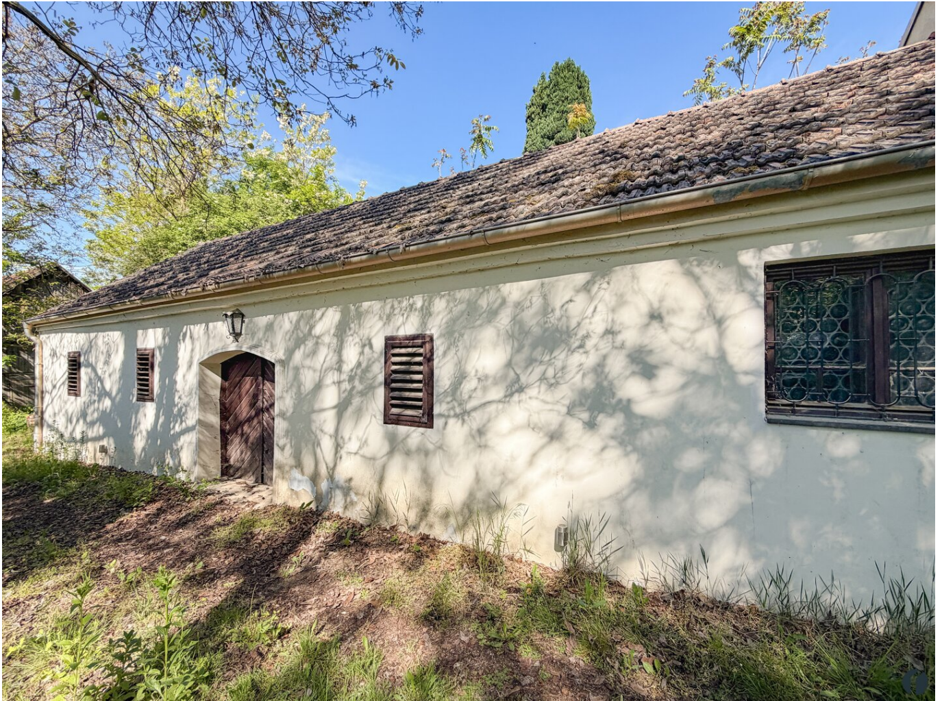
Außenansicht vom Weinkeller