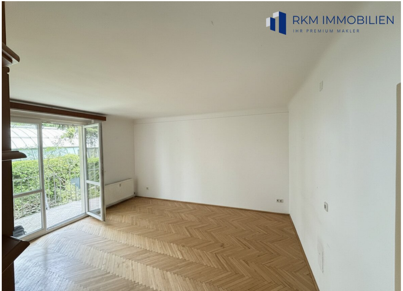
Zimmer mit Balkon