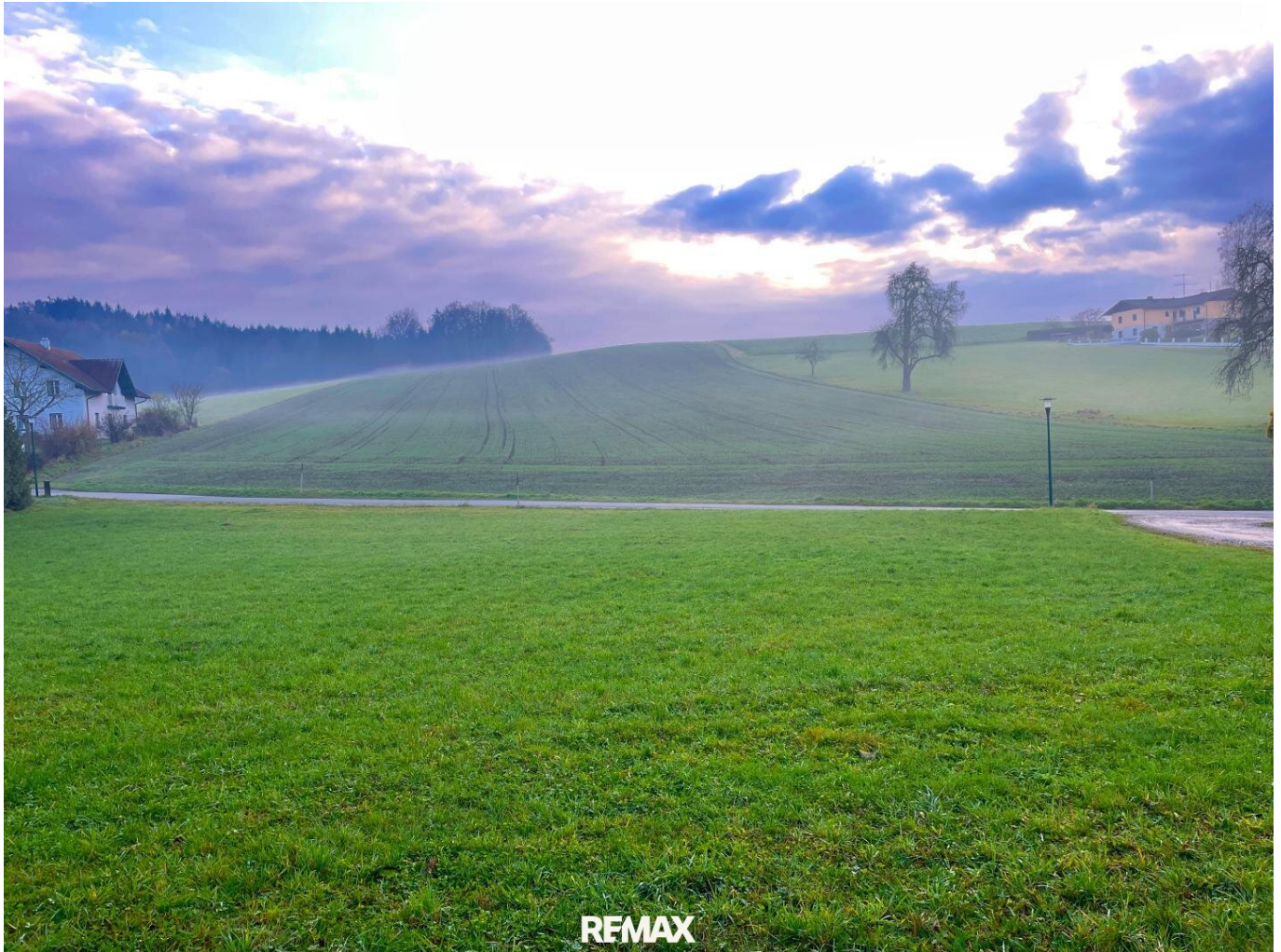
REMAX Grundstück Andorf (1)