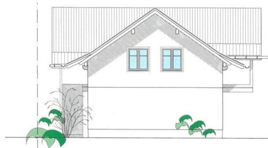
WEST - ANSICHT