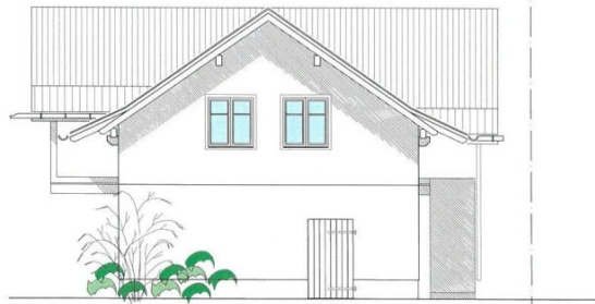
OST - ANSICHT