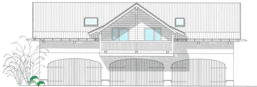
SÜD - ANSICHT