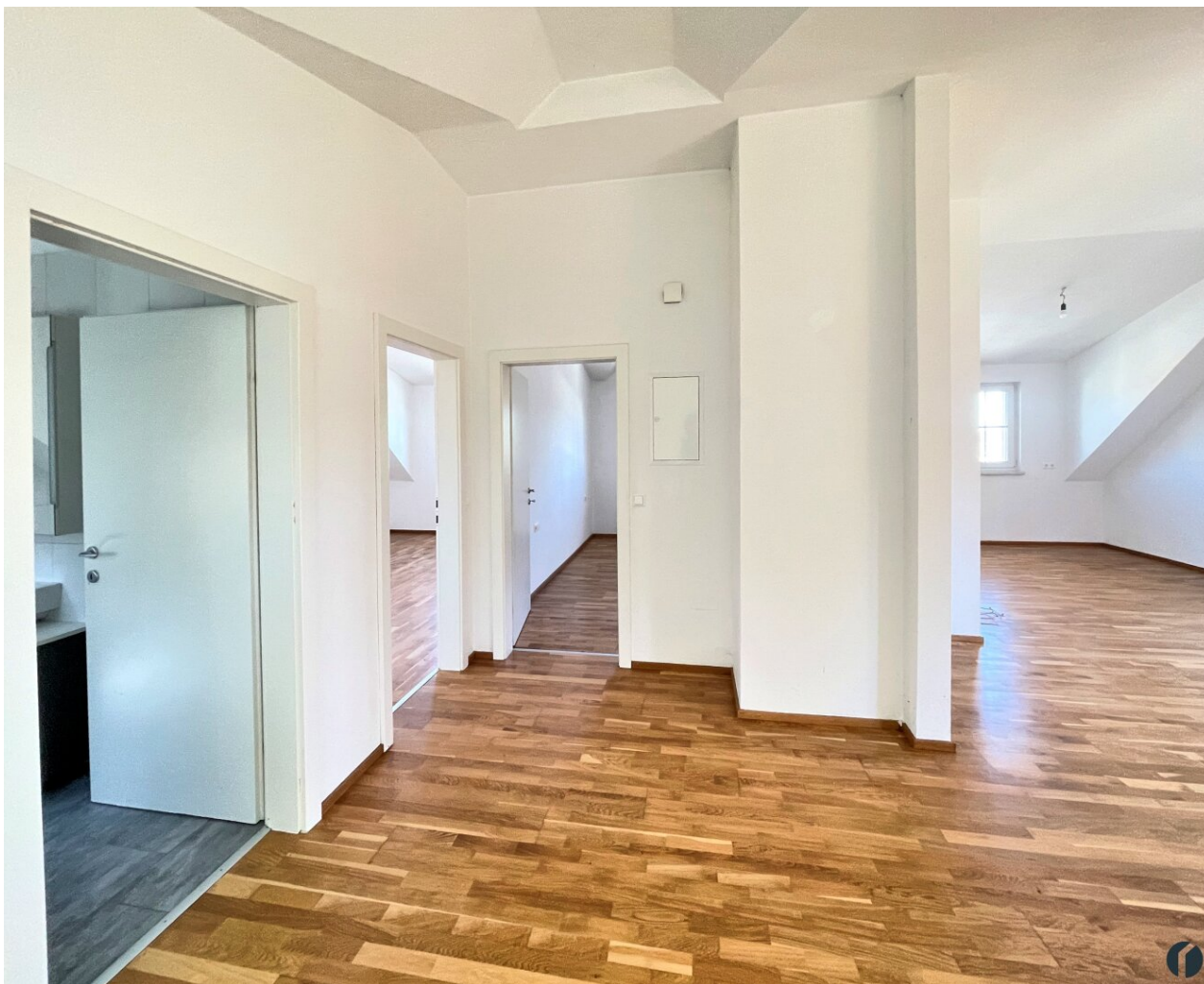
Blick vom Vorzimmer in die Wohnung