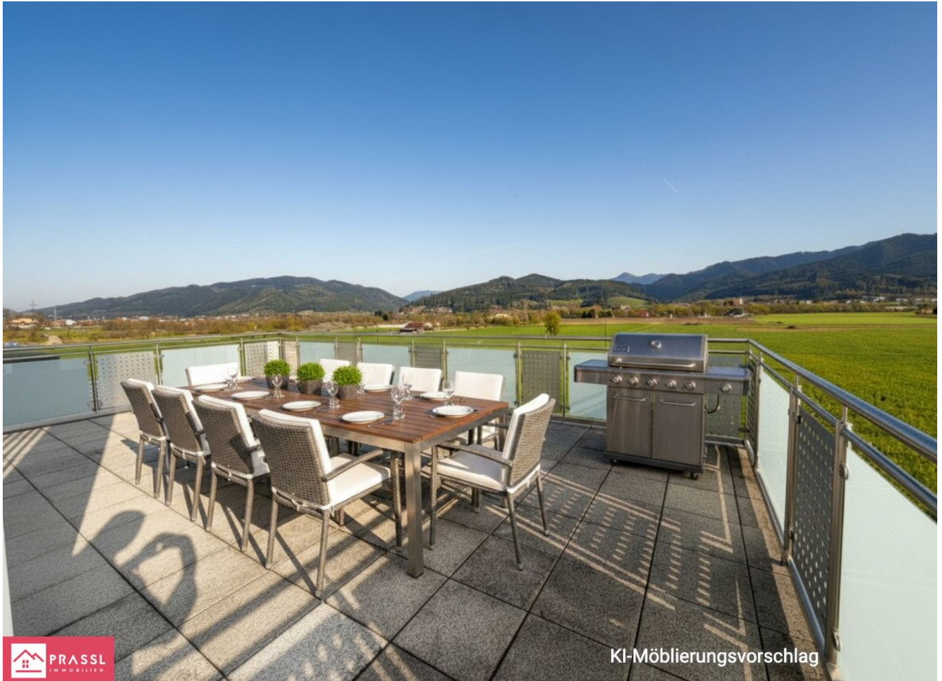
Hochparterre Terrasse - KI möblierungsvorschlag