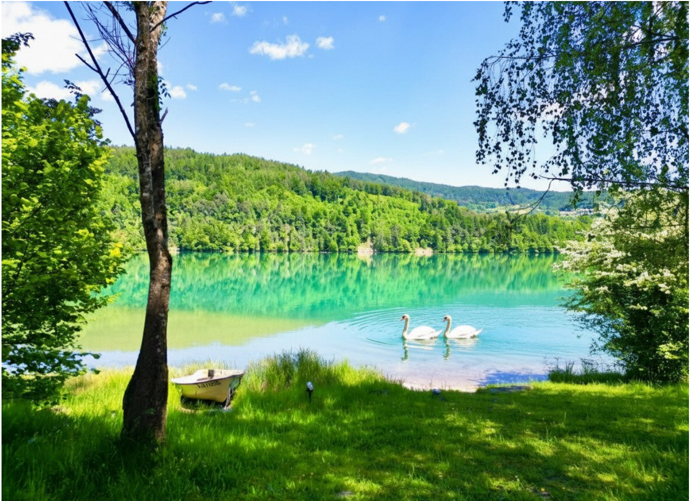
Bild vom See