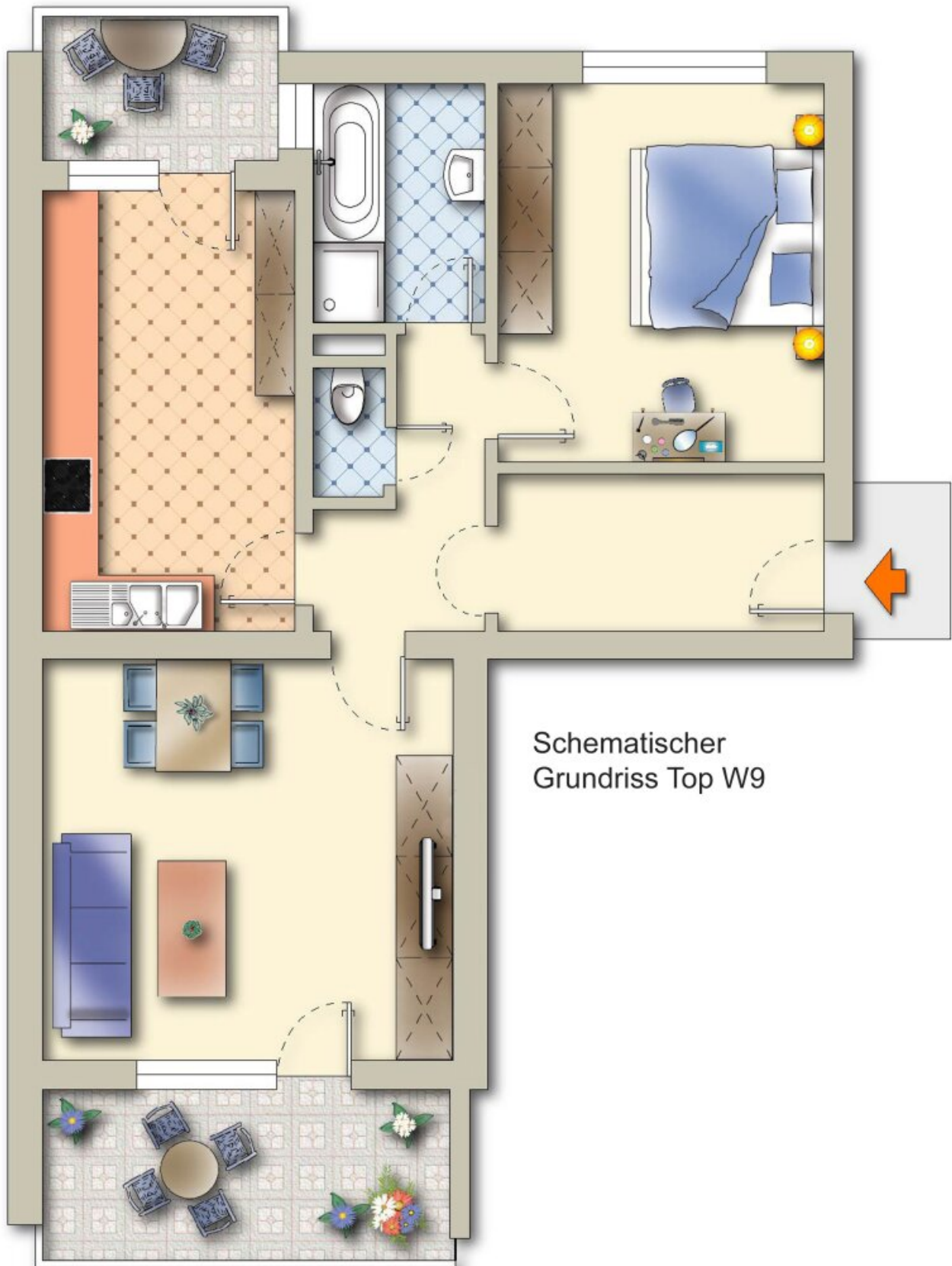
Schematischer Grundriss Top W9