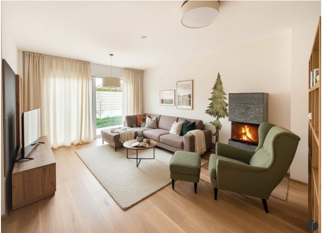
Einrichtungsbeispiel Wohnzimmer (KI_generiert)