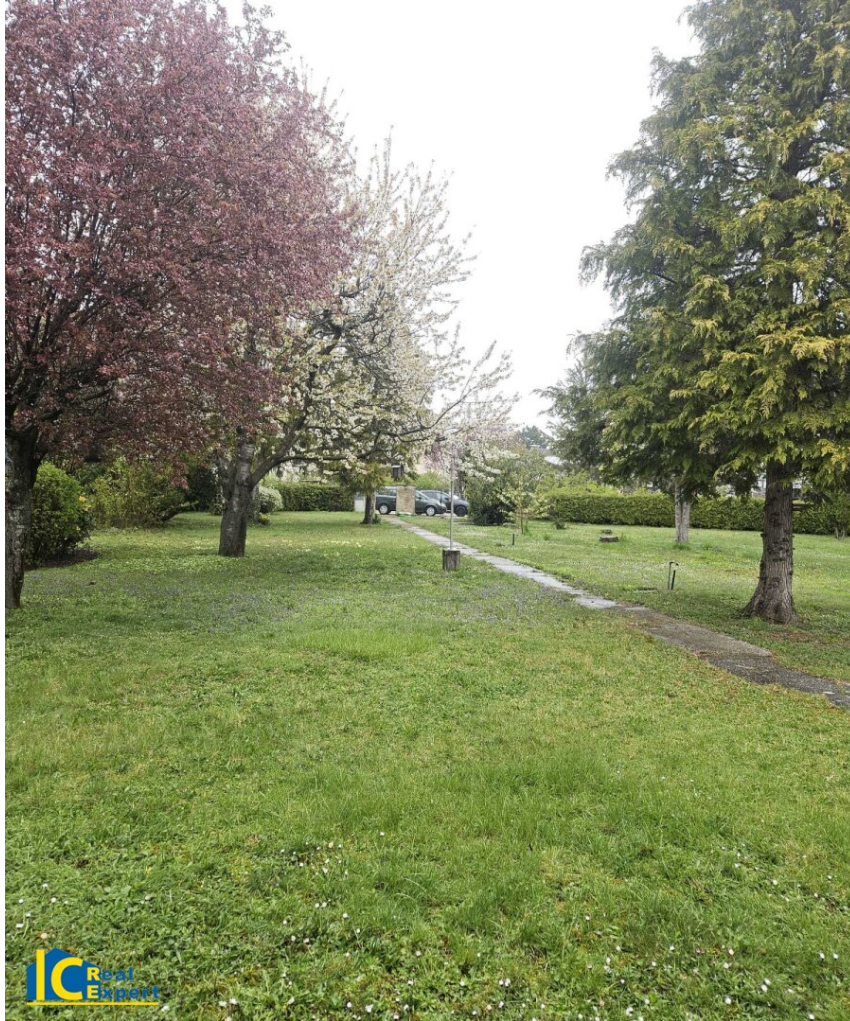
Großer parkähnlicher Grund

Objektnummer: 7603/581 Eine Immobilie von IC-Makler