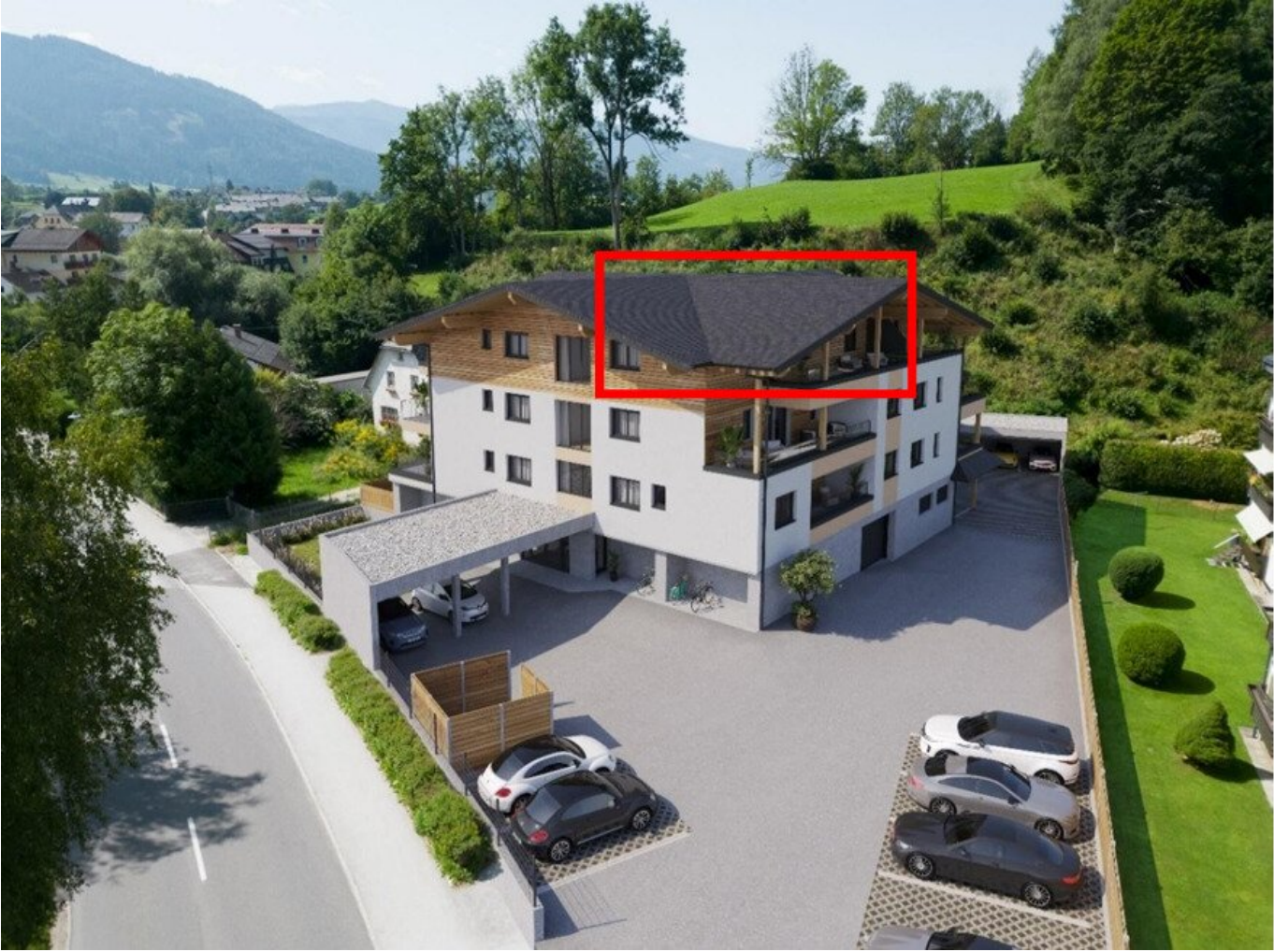
Nord-West Perspektive o.M.