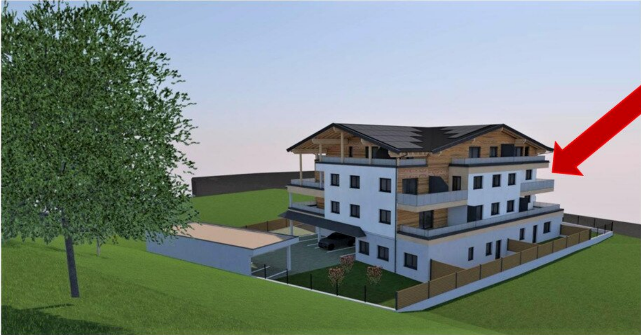
Ansicht Süd 1:100