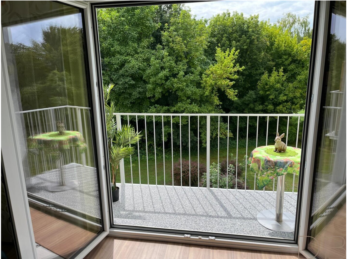
Balkon, frisch saniert