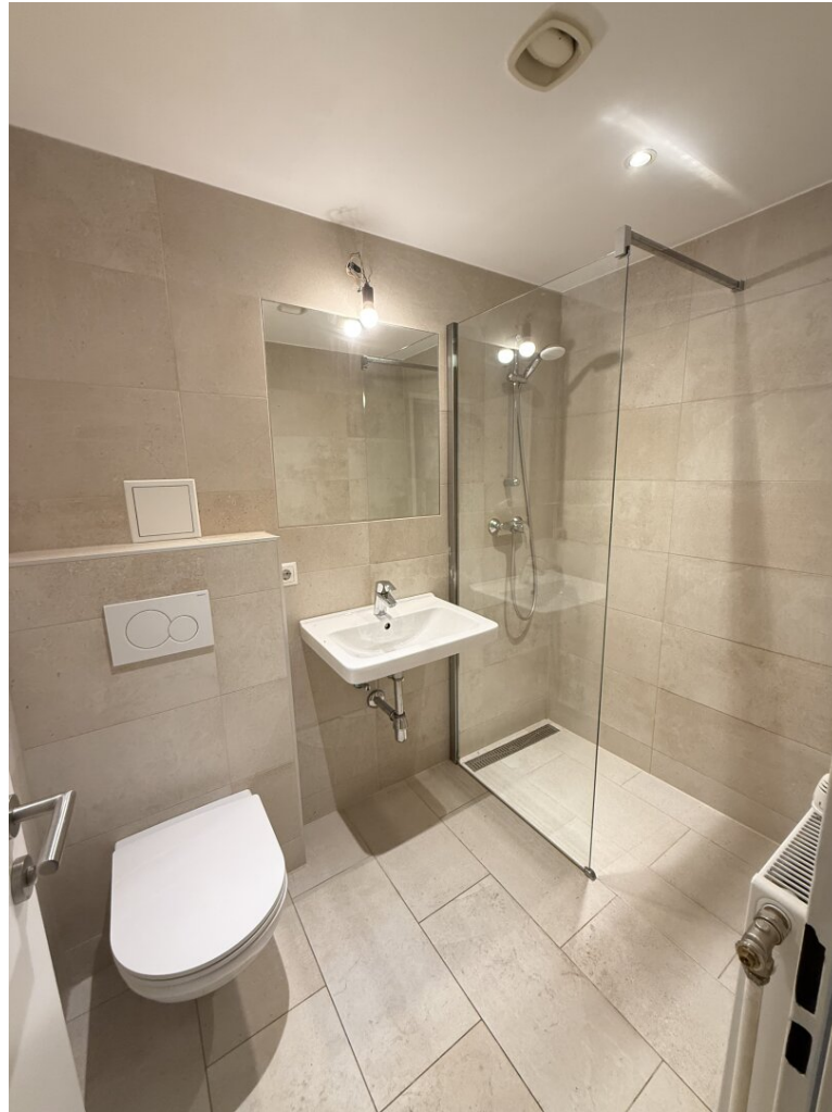
Bad: Dusche + WC