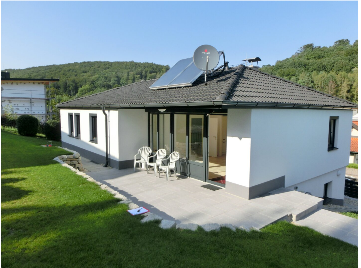
Hausansicht vom Garten