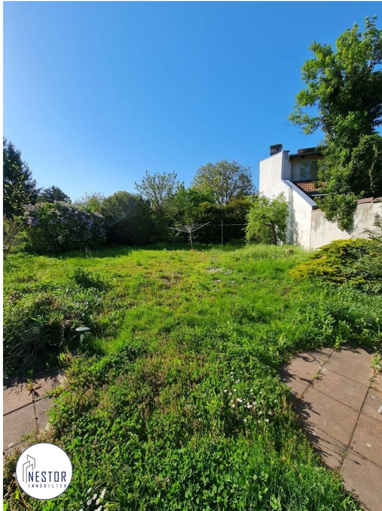
Grundstück - NESTOR Immobilien