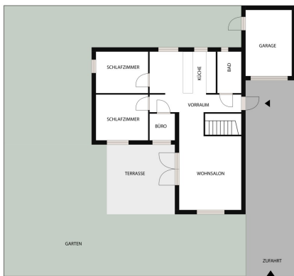
ACHTUNG: schematischer Grundriss! Bemalter Grundriss auf Anfrage!