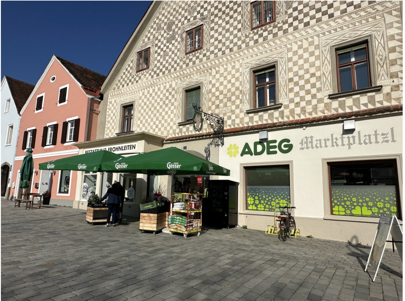
Vorderansicht - ADEG