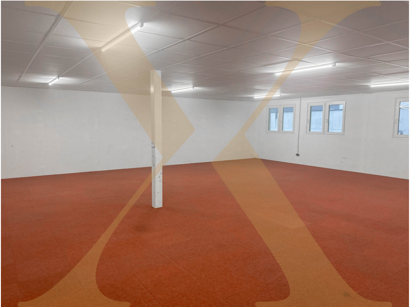
Beispielfoto Lagerraum I