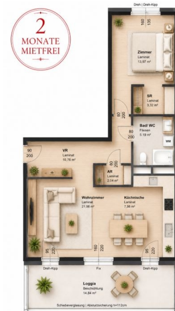
GR Top 04

Objektnummer: 141/85178 Eine Immobilie von Rustler