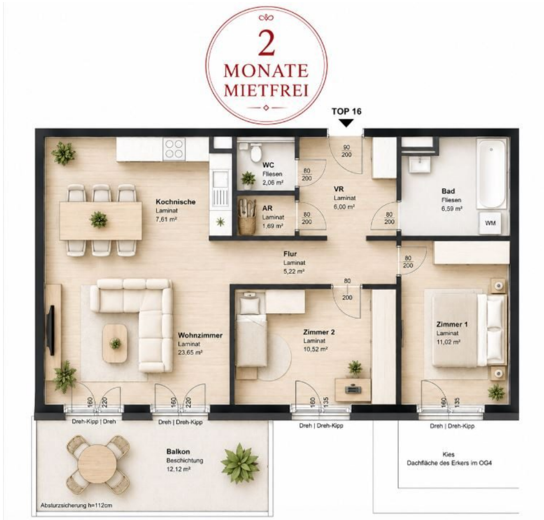
GR Top 16

Objektnummer: 141/84855 Eine Immobilie von Rustler