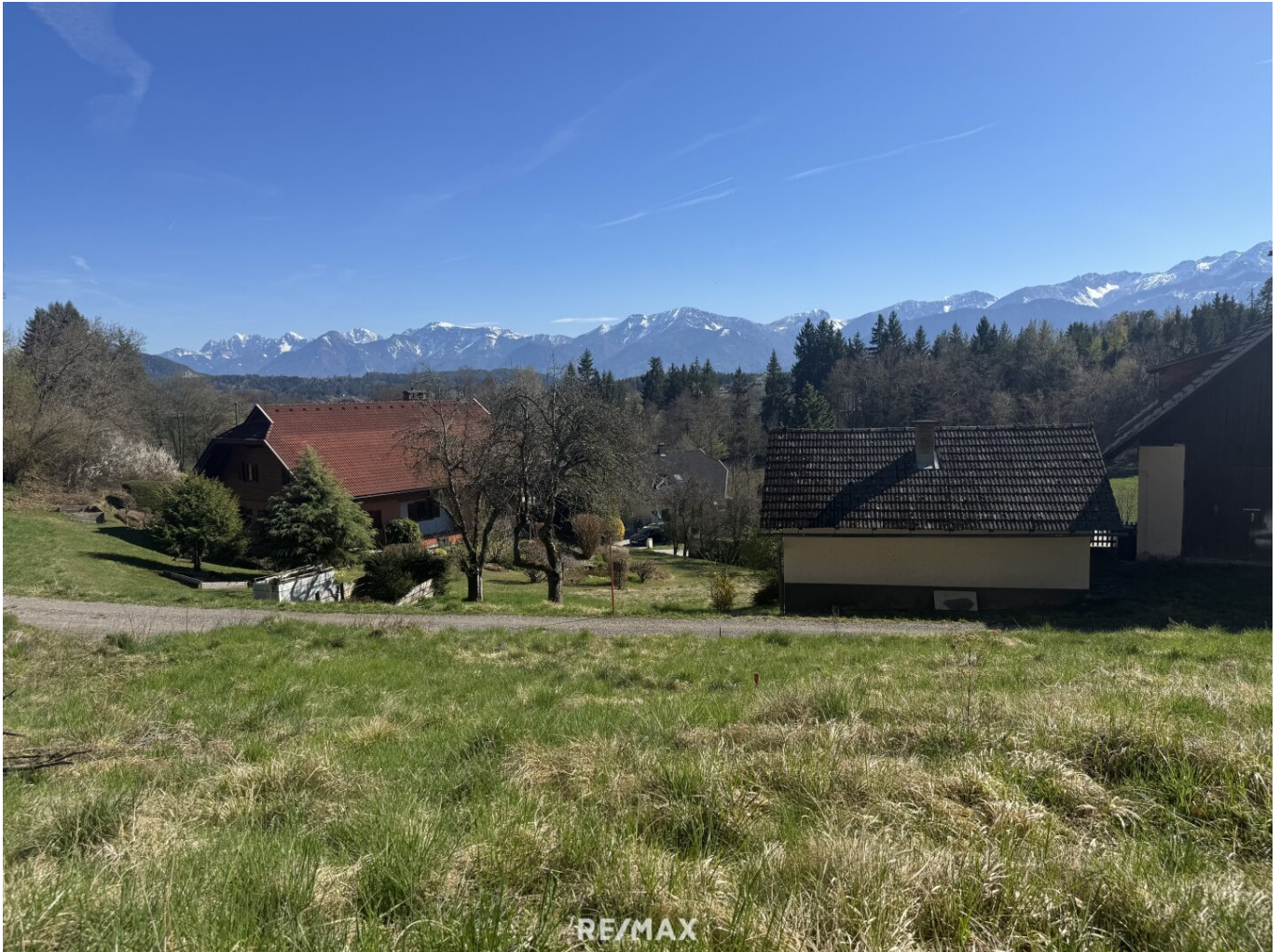
Grundstück 2+3 Aussicht Süden