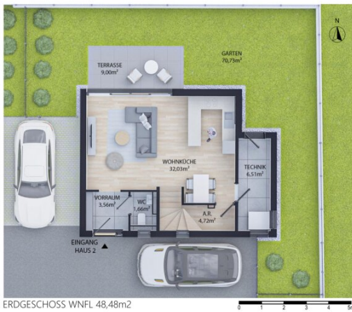
ERDGESCHOSS WNFL 48,48m 2

HAUS 2: WNFL 138,08m 2 + TERRASSEN ERDGESCHOSS 9,00m 2 DACHGESCHOSS 8,44m 2 + GARTEN 70,73m 2