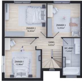
OBERGESCHOSS WNFL 56,19m 2