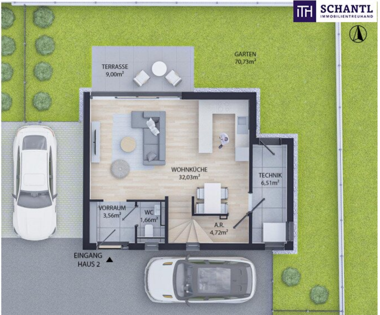
ERDGESCHOSS WNFL 48,48m 2