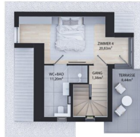
DACHGESCHOSS WNFL 33,41m 2