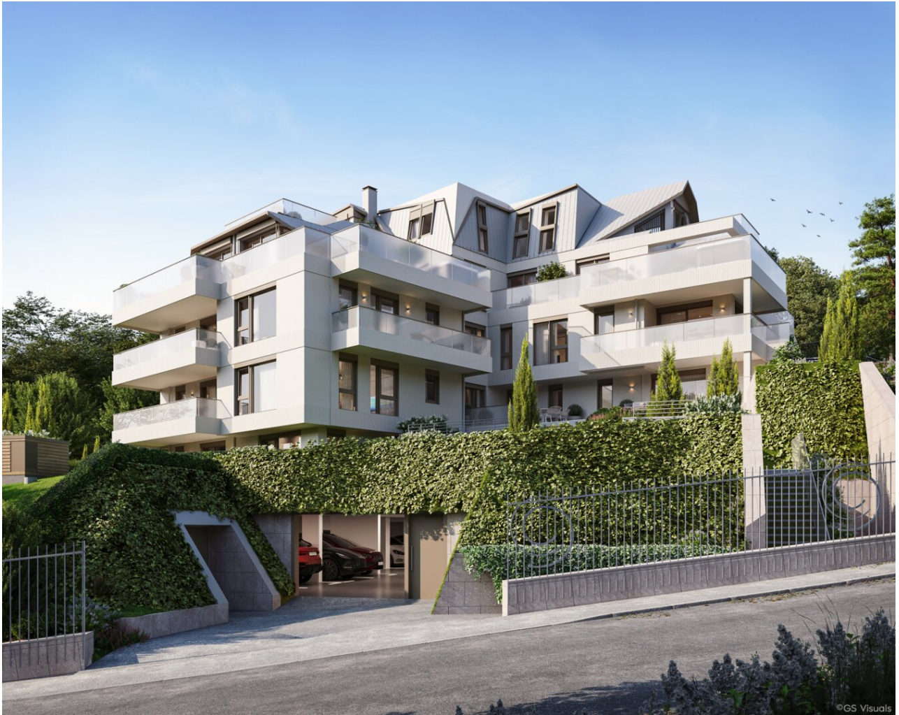
Cam 1_Cloud 9