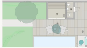
Variante mit Sauna