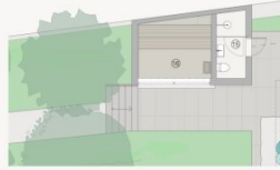
Variante mit Sauna