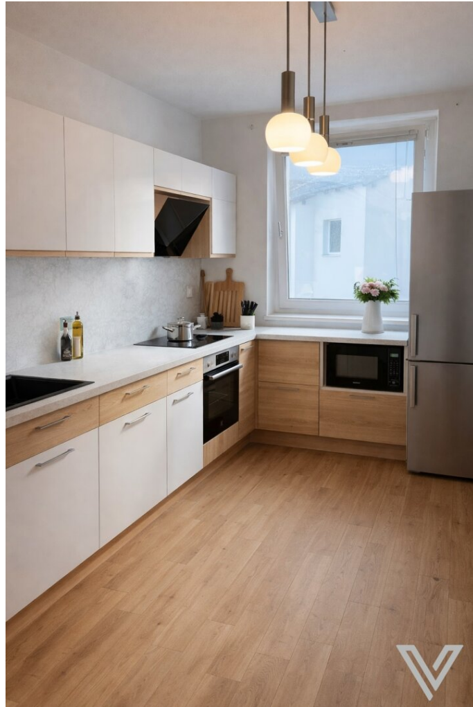
Küche KI generiert