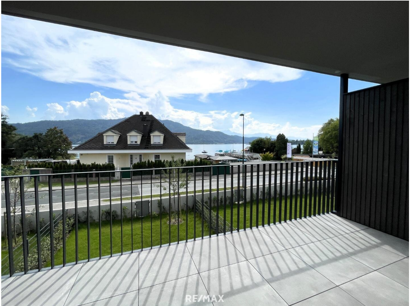
Balkon mit Seeblick