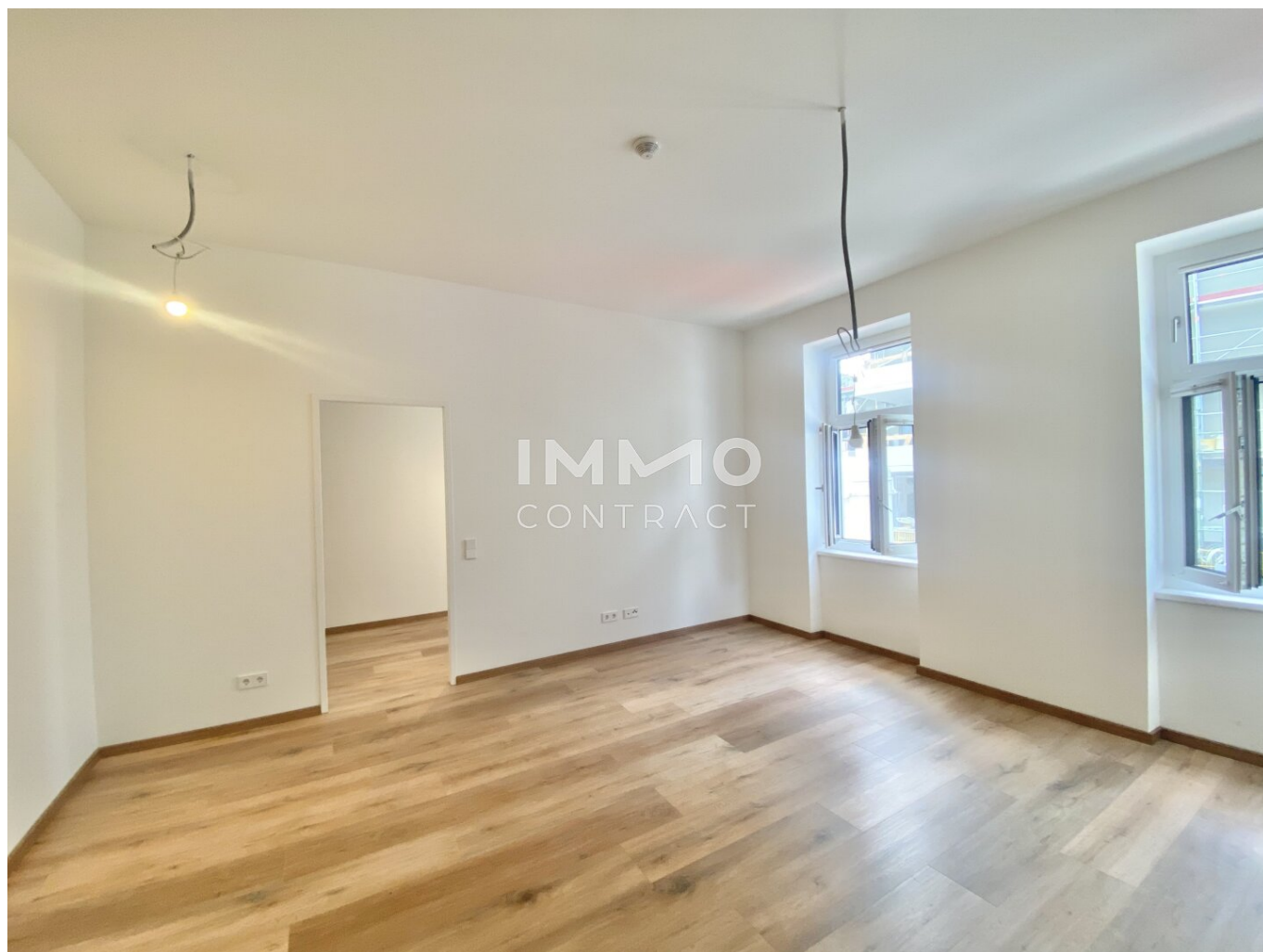
Wohnesszimmer oder Schlafzimmer 3