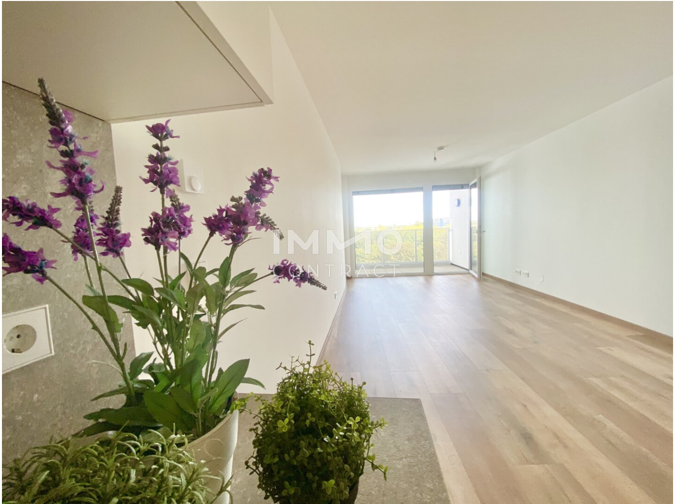
Küchenzeile mit Blick in den Wohnessraum