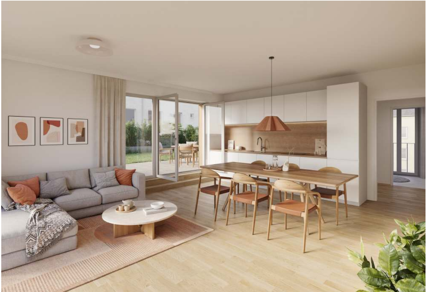
Rendering Wohnung 2