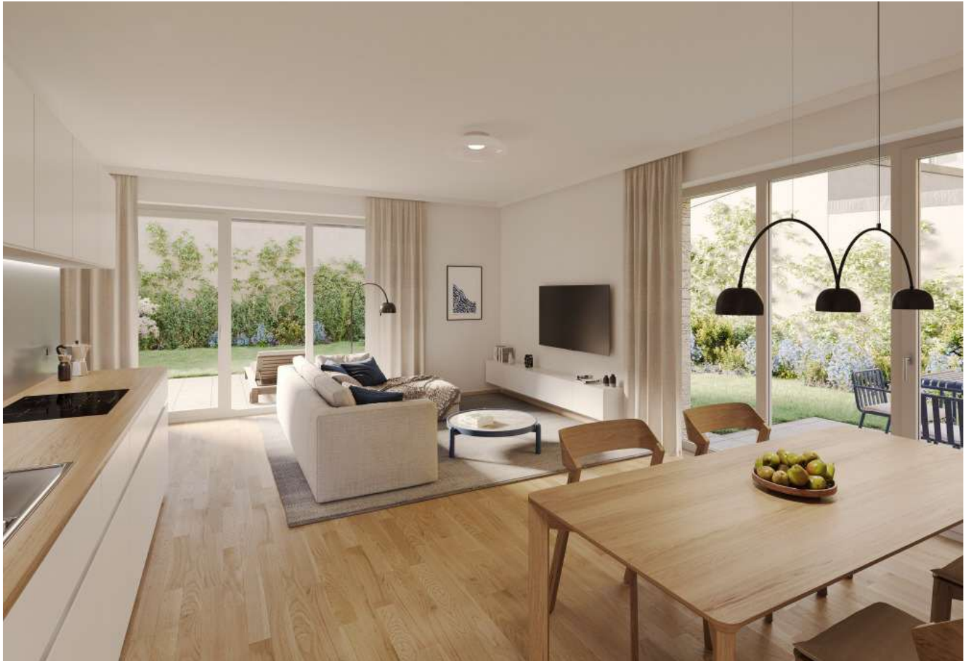
Rendering Wohnung 1