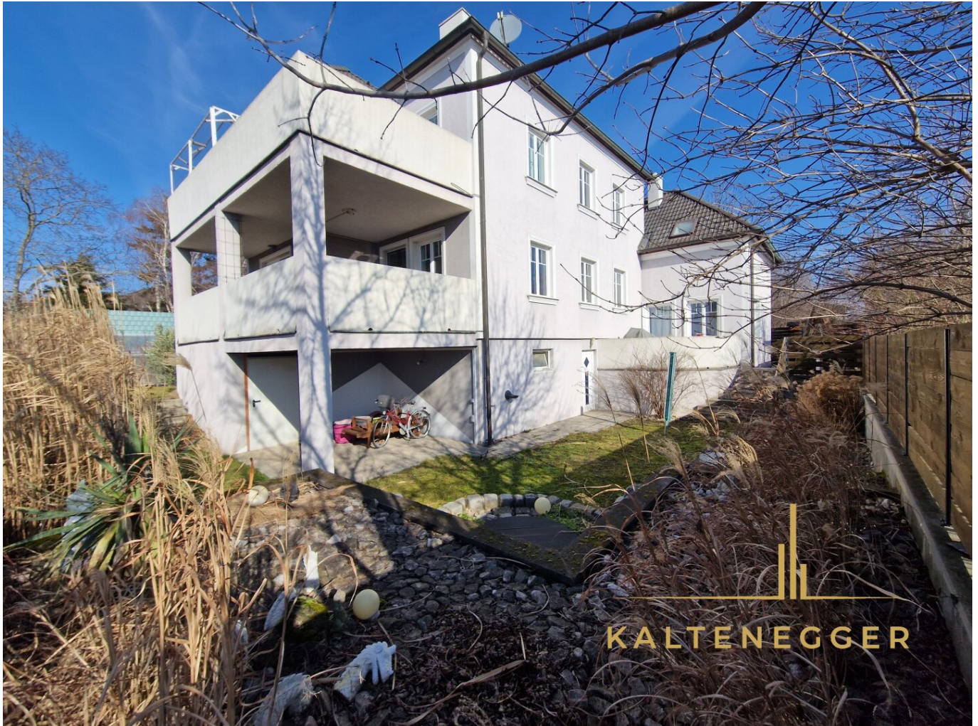
Hinterseite des Hauses mit dem asiatischen Garten