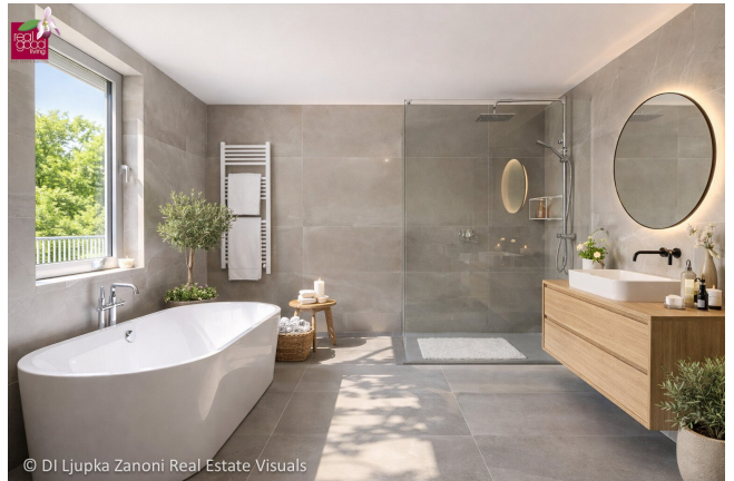
© DI Ljupka Zanoni Real Estate Visuals