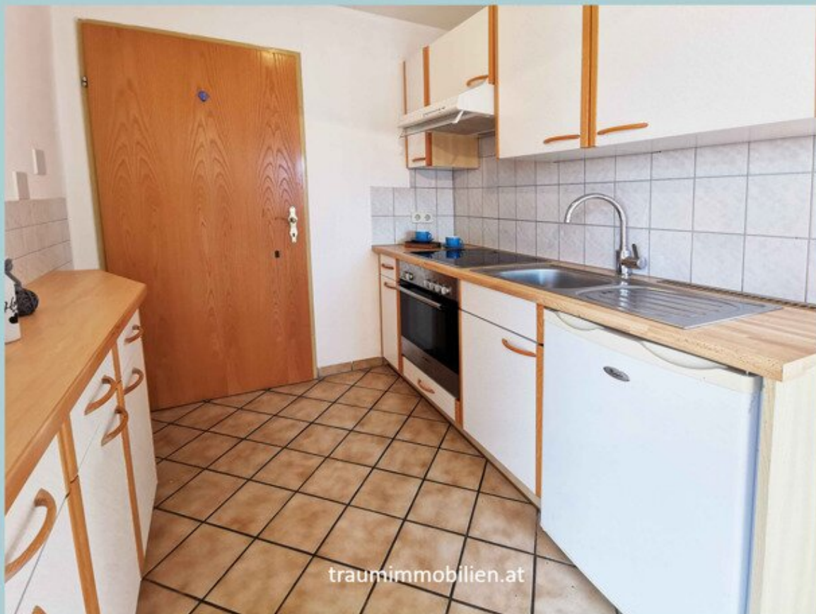
So sieht die Küche derzeit aus