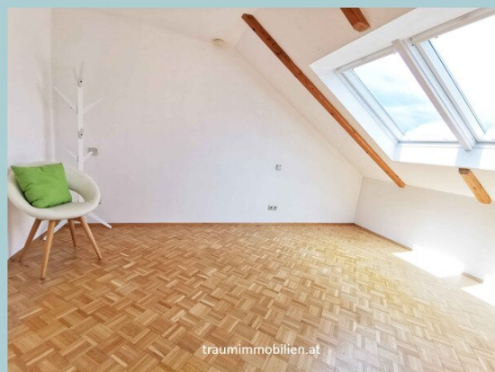
So sieht das Schlafzimmer unmobiliert aus