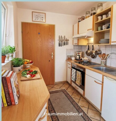
So könnte die Küche aussehen