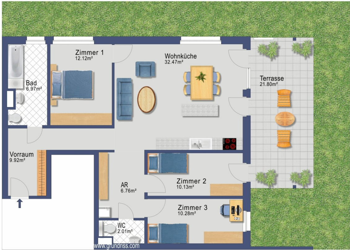
0 1 2 3 4 5m Erdgeschoss