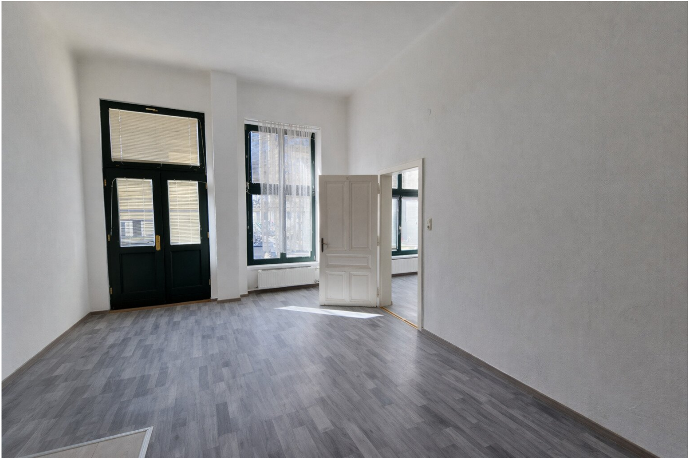
Eingang Raum 1