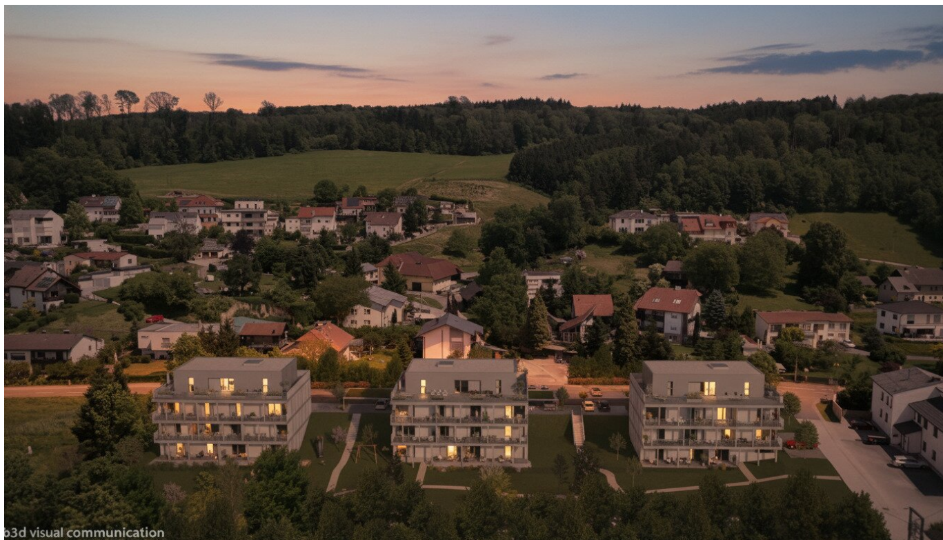
3d visual communication