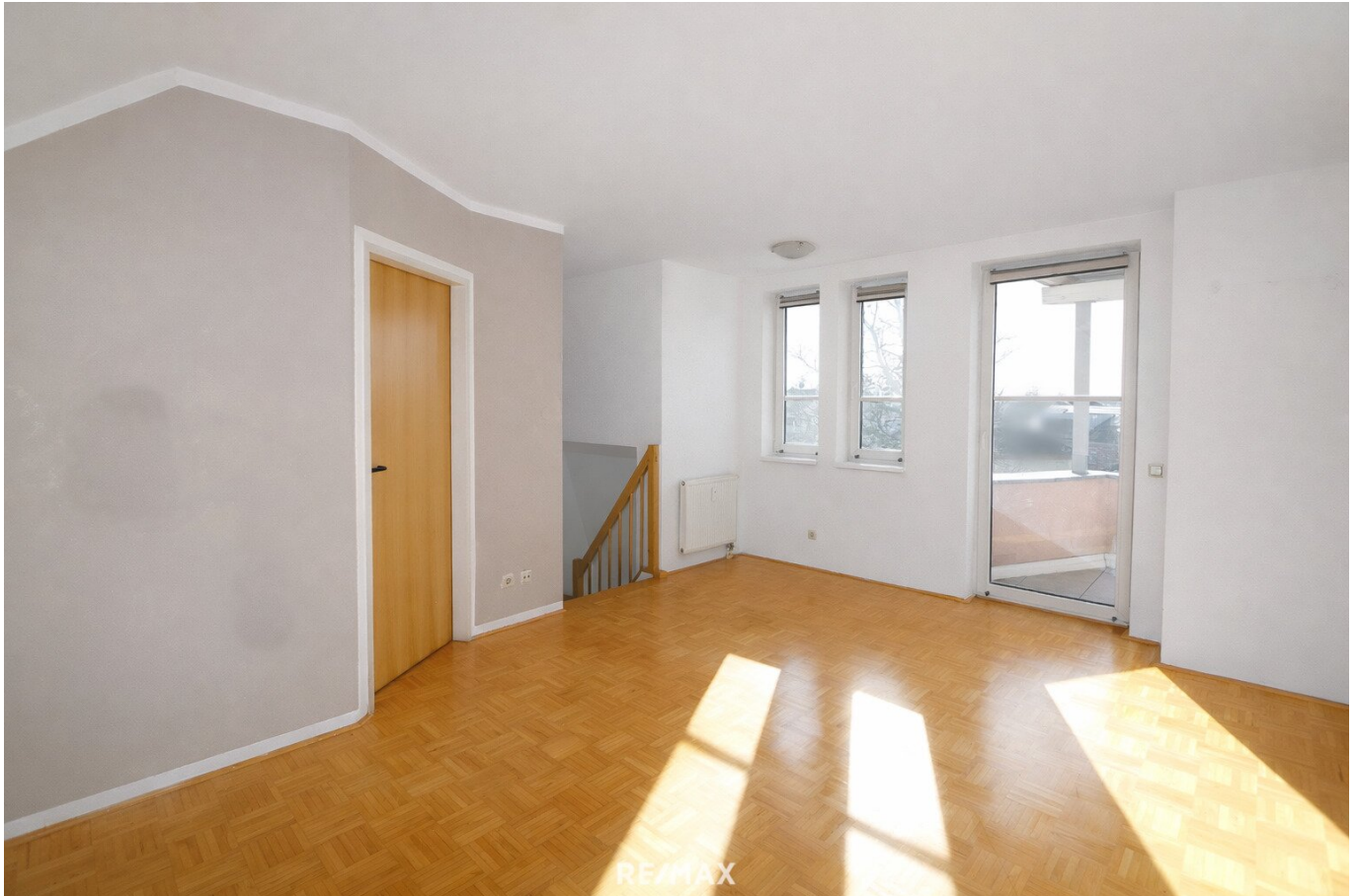
Titelbild - Wohnzimmer