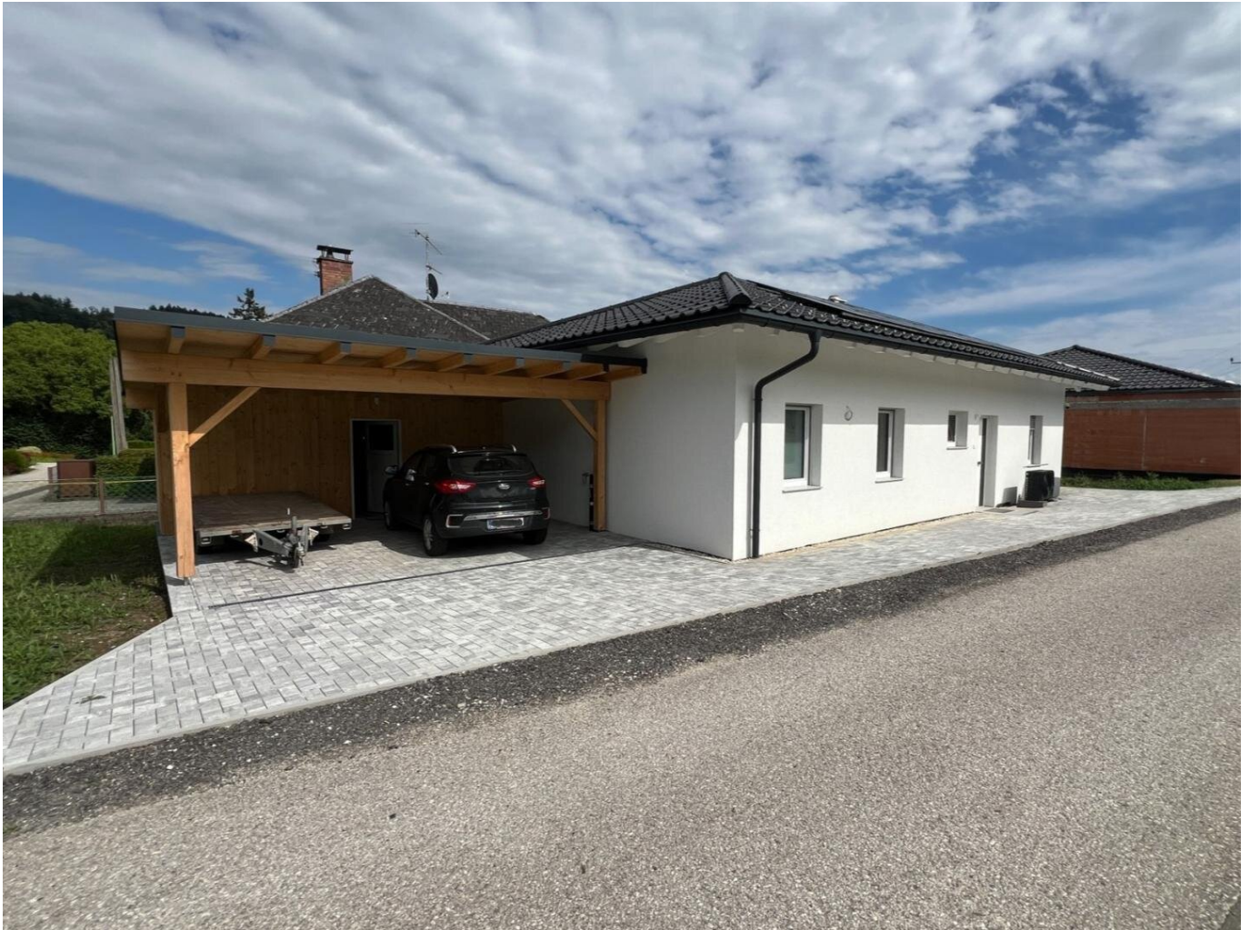
Carport und Abstellraum