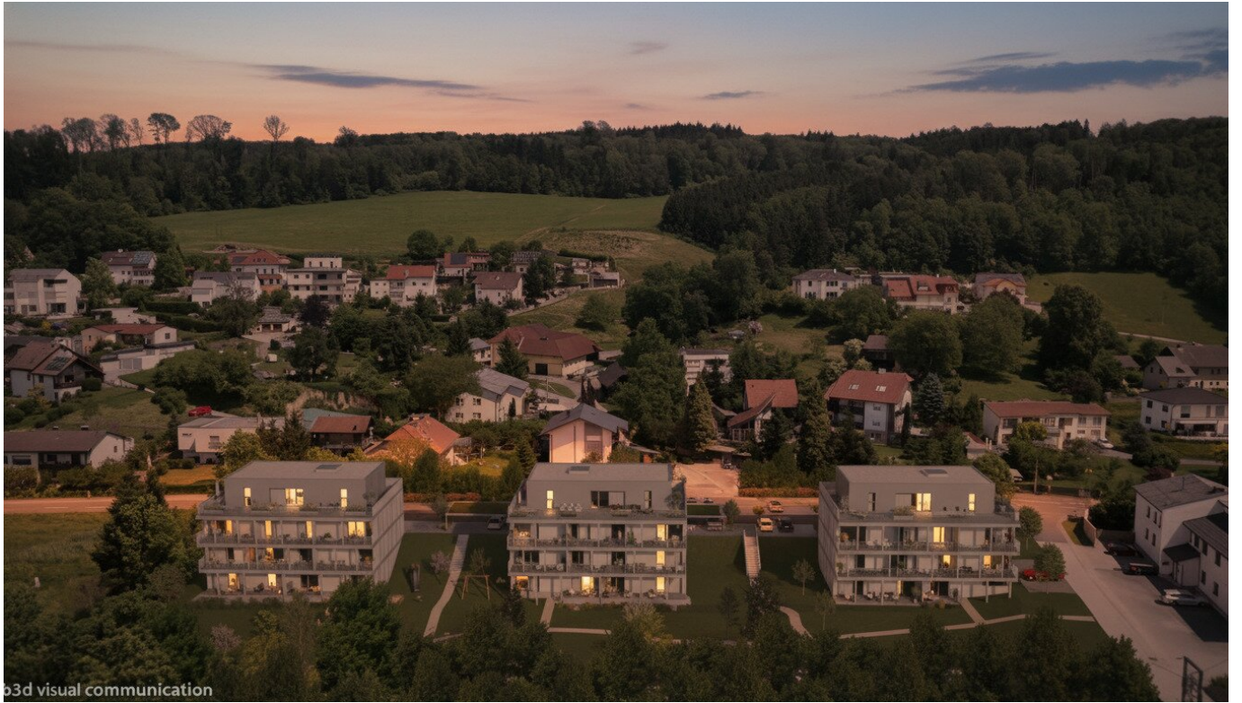
3d visual communication