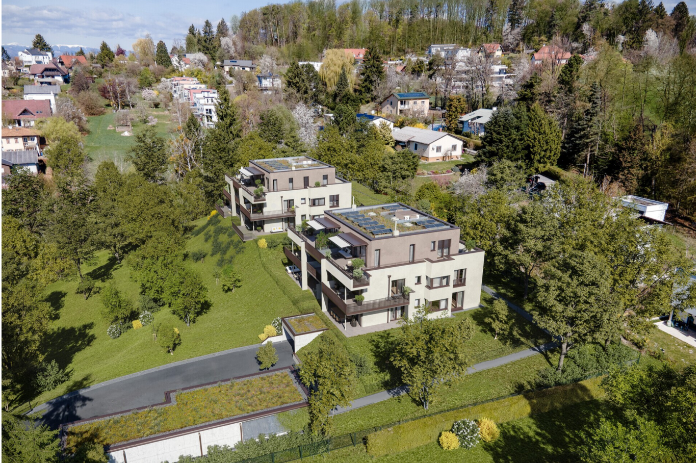
Luftschloss View 2

Objektnummer: 109251174_2 Eine Immobilie von ÖRAG Immobilien