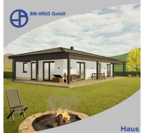
Haus Carina 100 Schlüsselfertig inkl. Bodenplatte