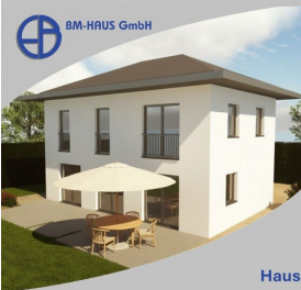
Haus Bianca 116 Schlüsselfertig inkl. Bodenplatte