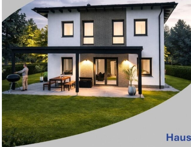
Haus Bella 114 Schlüsselfertig inkl. Bodenplatte