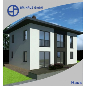
Haus Leona 125 Schlüsselfertig inkl. Bodenplatte