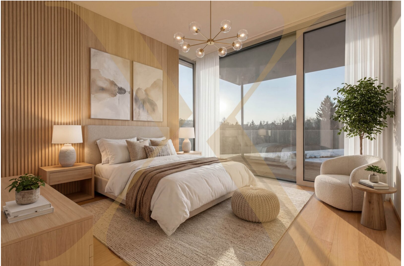
Schlafzimmer - KI-Visualisierung