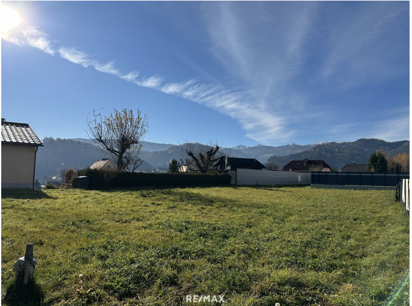
Grundstück in Judenburg

Objektnummer: 1679/1592 Eine Immobilie von RE/MAX Life