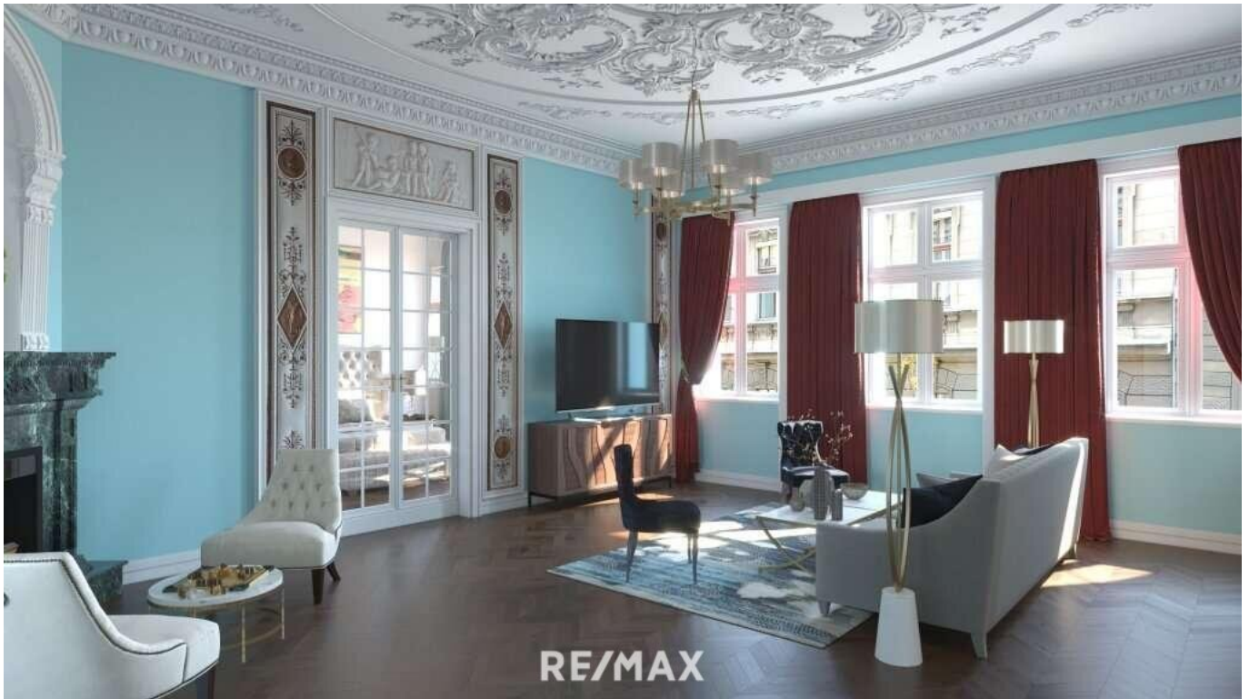
Bild 1 Wohnung 1070 Wien

Objektnummer: 1662/2948 Eine Immobilie von RE/MAX 4You