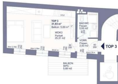
Übersichtsplan: 1. OG