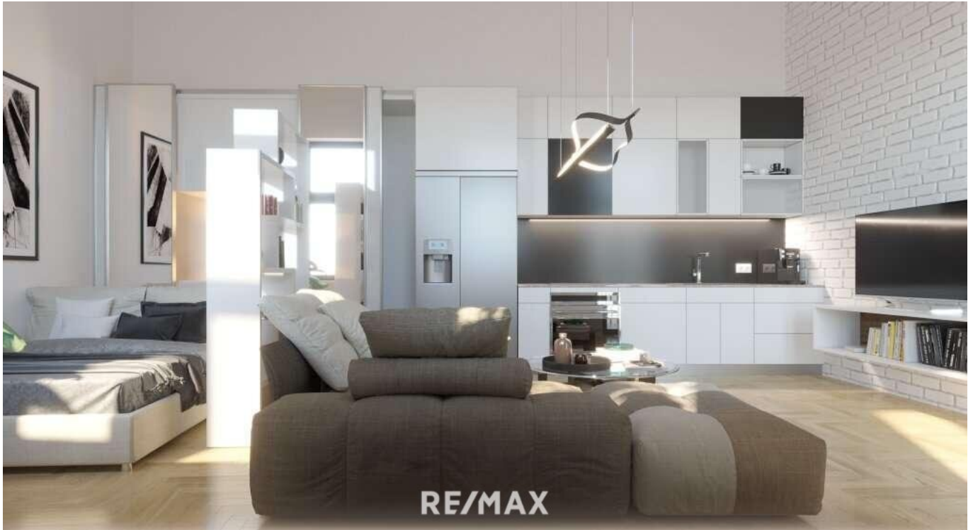
Bild 1 Wohnung 1070 Wien